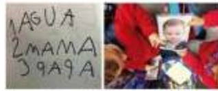
Muestras de intercambio de anécdotas personales y las notas con la primera palabra.